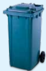
CONTENITORE BLU 240 LT PER I CONDOMINI

GETTALI CON LA BUSTA NON NERA CORRETTAMENTE CHIUSA