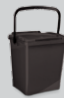
MASTELLO GRIGIO 40 LT PER LE SINGOLE ABITAZIONI