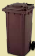
CONTENITORE MARRONE 240 LT PER CONDOMINI