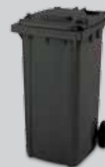
CONTENITORE GRIGIO 240 LT PER CONDOMINI

GETTALI CON LA BUSTA SEMITRASPARENTE CORRETTAMENTE CHIUSA