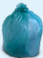
SACCHI NON NERI PER LE SINGOLE ABITAZIONI