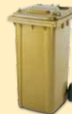
CONTENITORE GIALLO 240 LT PER I CONDOMINI

GETTALI SFUSI O CON BUSTA DI CARTA NEI CONTENITORI