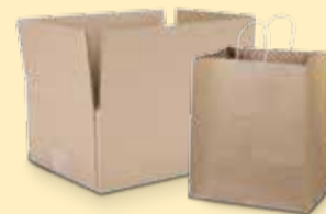
QUALSIASI CONTENITORE IN CARTA PER LE SINGOLE ABITAZIONI