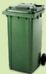
CONTENITORE VERDE 240 LT PER I CONDOMINI

GETTALI SFUSI SENZA BUSTA NEI CONTENITORI